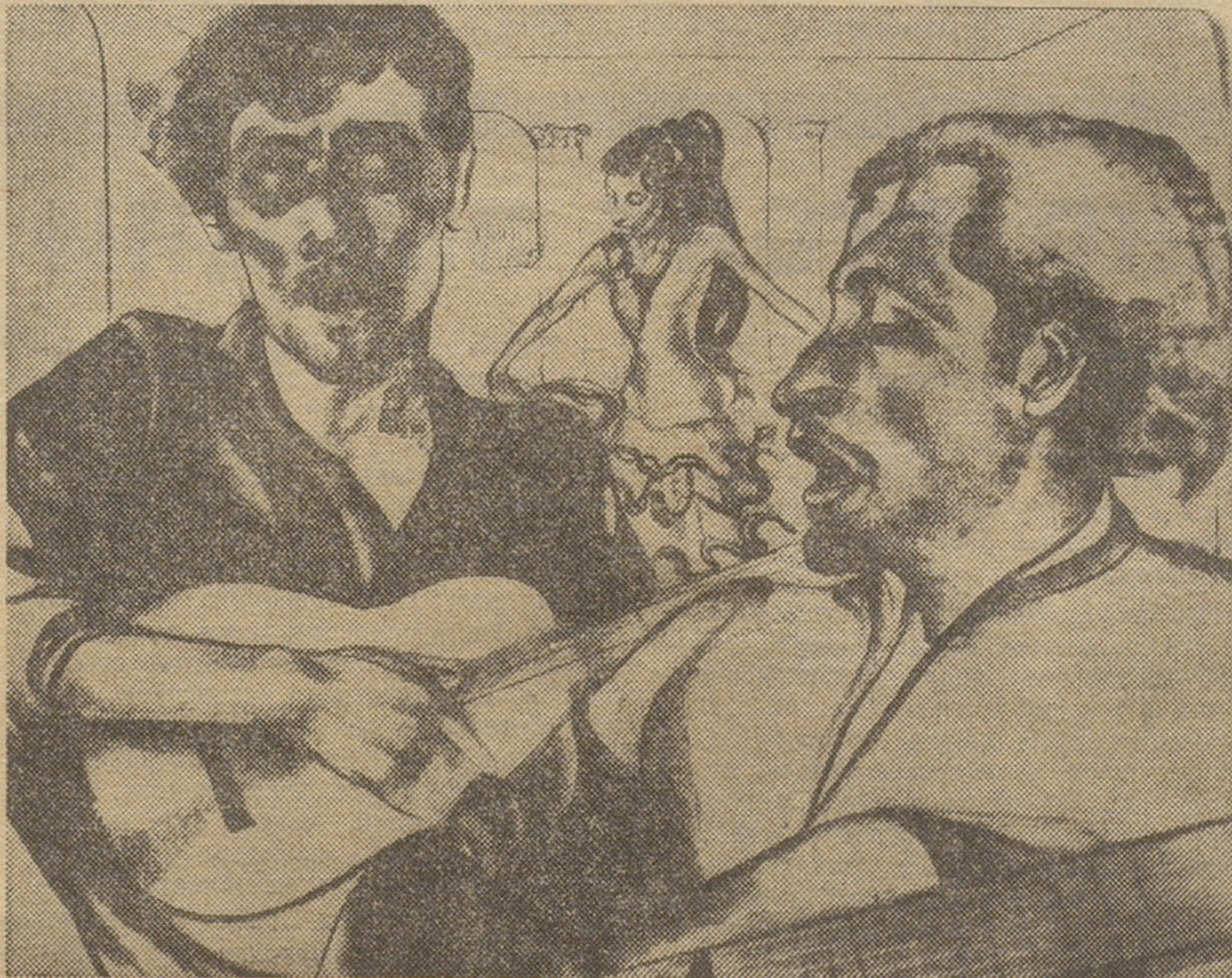
● Концерт в руинах Гранд-отеля.